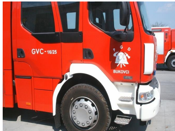
Primer taktične oznake: GV - 1