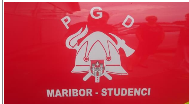
Primer oznake na vratih